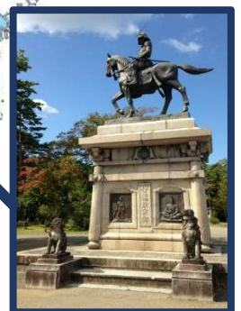
伊達 政宗 像