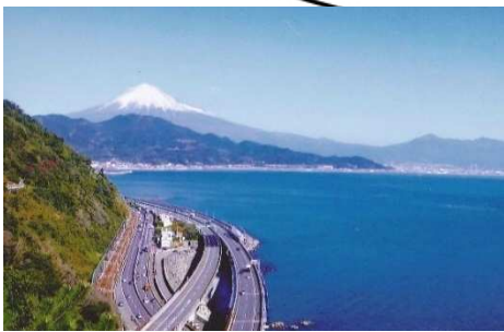
ゆひさつた 由比薩埵峠 今昔