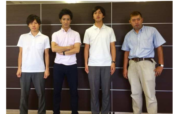
代表取締役 登博史氏(左から2番目)