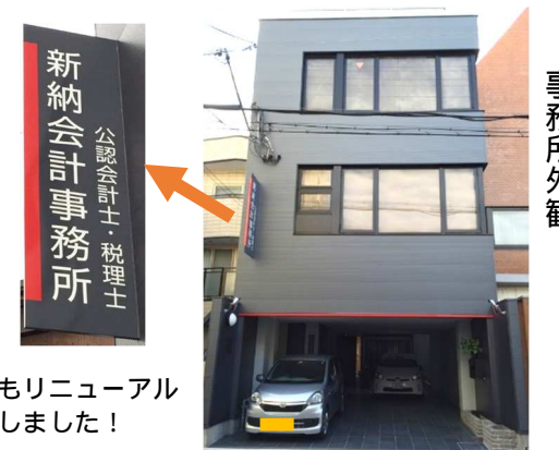
看板もリニューアルしました！