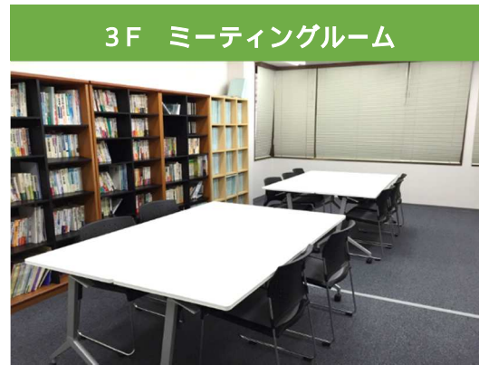
3F ミーティングルーム

入口付近には、書類の御受渡しや簡単な打ち 合わせスペースがございますので、お気軽に お立ち寄りくださいませ