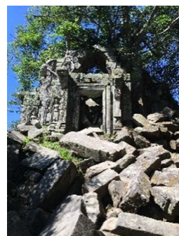
<ベンメリア（城跡）> 天空の城ラピュタのモデルになったとも言われる。

昨年11月、母とカンボジア旅行に行ってきました。歴史好き、遺跡（建築）好きの私にとって、カンボジアは憧れの国でした。古代より三毛作が可能な場所もあるほど水源豊富な場所に立つ「アンコールワット」は幻想的でとても美しかったです。乾季の気温は日中40度を超えますが、移動は専用車両ですし、遺跡のそばには水洗トイレが完備されており南西アジアでも快適な旅を満喫しました。