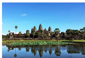
<アンコールワット（寺院）> 朝日を見る為に早朝から多くの観光客が訪れる。

なお、カンボジアは外務省の安全情報では危険レベル1に該当します。旅行は現地ガイド付きのツアーをご利用ください。