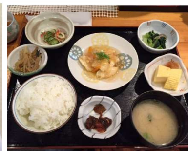
朝定食にだし巻を追加注文しました

<住所> 京都市下京区朱雀分木町 京都中央市場関連 12号棟 <電話> 075-311-6726 <営業時間> 7:00~13:30 (ラストオーダー) <定休日> 日曜、祝日、市場の休場日 専用の駐車場はございませんので、お近くのパーキングをご利用下さい。