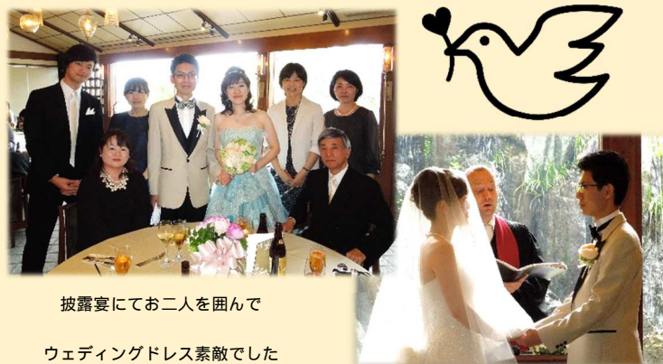
披露宴にてお二人を囲んで

これからは夫と共に歩んでまいります。まだまだ未熟な私ですが、これからもよろしく願い致します。