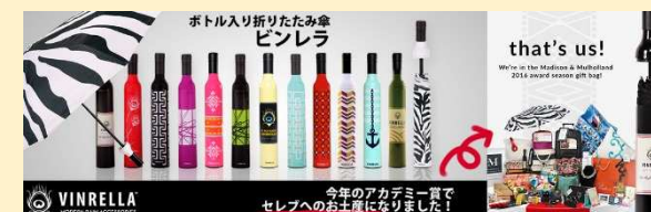
アカデミー賞でセレブのお土産になったボトル入り折りたたみ傘 ビンレラ

【買付け屋 本店】 <HP> https://kaitsuke-ya.com/ <お問い合わせ> support@kaitsuke-ya.com 【カリフォルニアの情報サイト(かりふおるに屋)】 <HP> http://californi-ya.com/ 【日本代理店募集サイト(かりふおるに屋 B2B)】