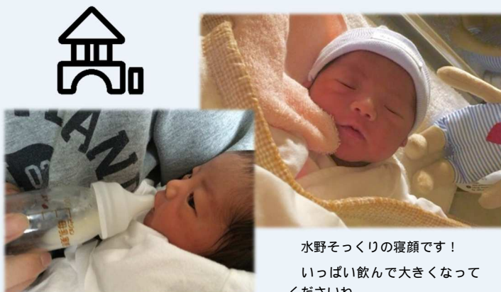
水野そっくりの寝顔です！ いっぱい飲んで大きくなって くださいな